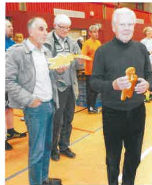
Unser Pokal: Ein Stutenkerl !